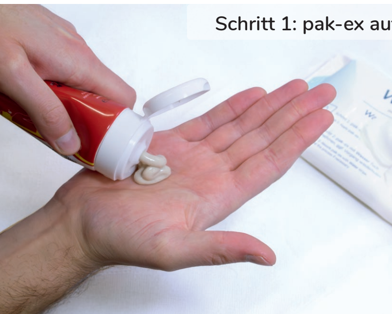
Schritt 1: pak-ex auf der Haut auftragen